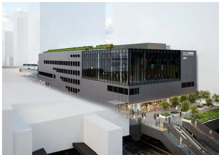
完成時の外観(2030年頃 イメージ③)