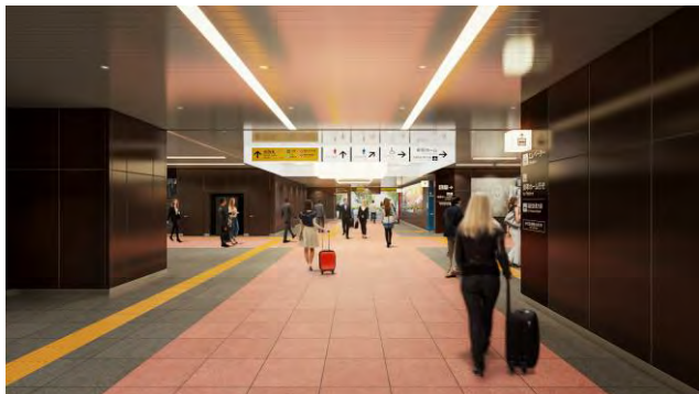
改札内コンコース(イメージ①)

新たな北改札・中央改札を使用開始し、現在の中央口改札および南口改札を閉鎖します。