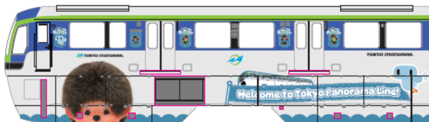
<山側 2 号車>