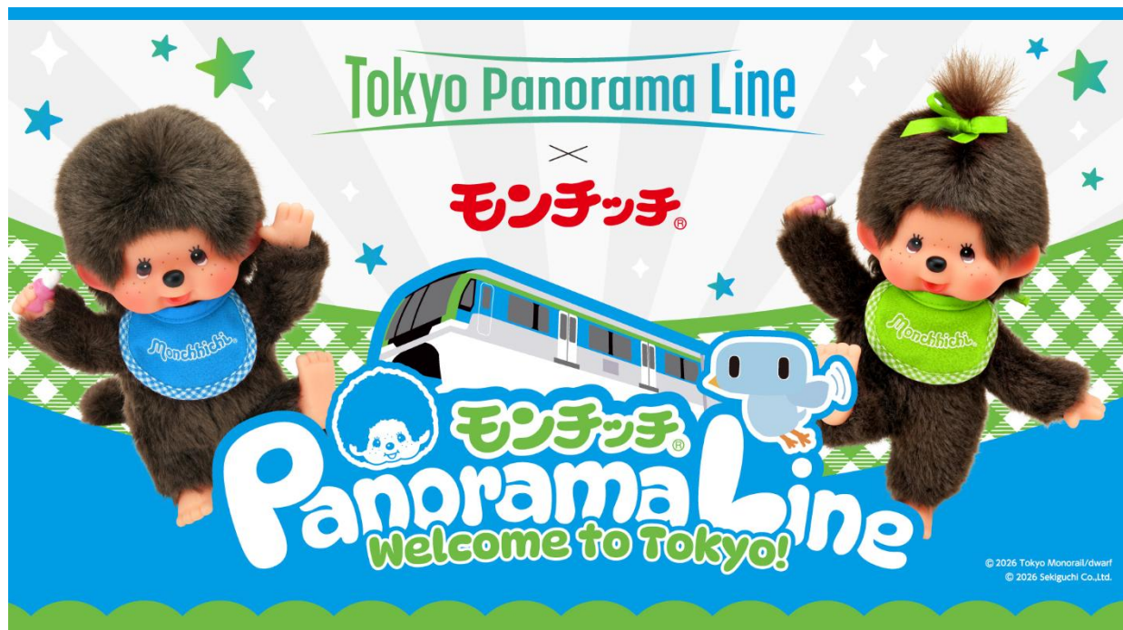
「東京パノラマライン」×「モンチッチ」コラボ列車のイメージ

この度、1974 年の発売から現在まで、日本や世界中で多くの人々に愛され続けている「モンチッチ」が「パノラマ大使」として東京パノラマラインの車両に登場！日本の玄関口である羽田空港から東京都心へ向かう皆さまを、モンチッチが特別車両でお出迎えします。