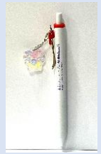
チャーム付きボールペン

※ チャーム付きボールペン(赤・青)は販売箇所全体で先着 1,000 名様に限ります。