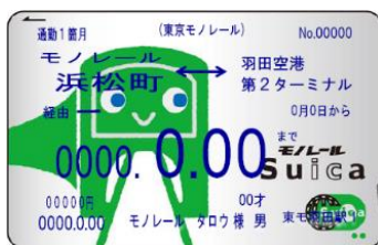
モノレール Suica 定期券