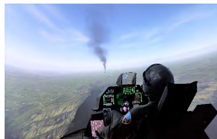
戦闘機ファイター体験