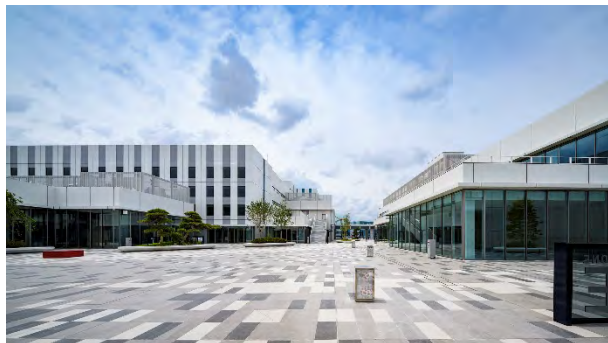
イノベーションコリドーからみる建物群

HiCity の各建物を結ぶイノベーションコリドーは、日本庭園の配植をベースにした植栽や、花札の絵柄に現代モダンアートの要素を加え、さらに日本の四季折々の音を奏でる「花燈籠」が施されており、訪れる人を迎え入れます。また、施設の屋上には、足湯スカイデッキが整備され、羽田空港を望む絶景を楽しむことができます。季節による植栽の変化や、イベントなどの開催に合わせたライティングや音の変化によって、HiCity を訪れた方々に向けて、日本の四季や文化の美しさを提供します。