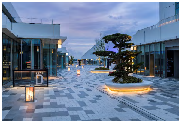
日本庭園の配植をベースにした植栽