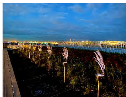
穴守稲荷の神紋をモチーフにした稲穂照明