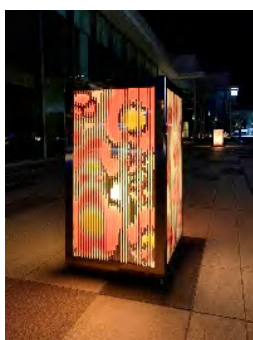
四季折々の音を奏でる花燈籠