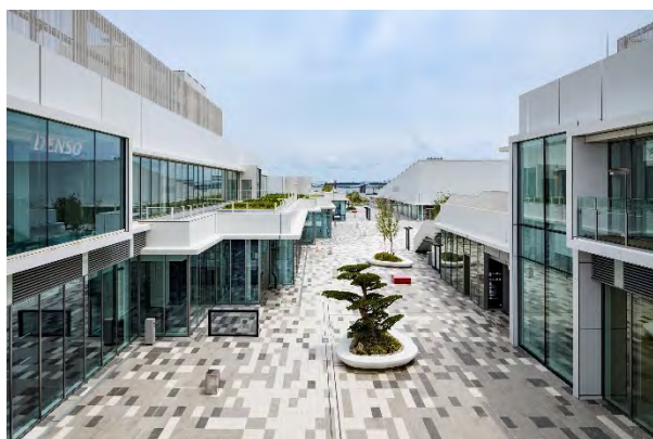
イノベーションコリドー