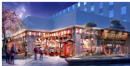
日本食体験レストラン

海外の観光客へ日本食や日本の食文化を発信することはもちろん、日本人にとっても日本食の魅力を再発見できるよう各分野において本物の「ルーツ」を持つ名店とコラボすると同時に、昔ばなしの世界に入り込んだような空間づくりにこだわり、日本の文化を五感で楽しめる空間です。