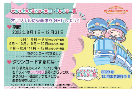
【特設ポスターイメージ】