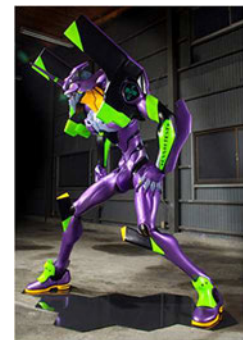
エヴァンゲリオン初号機(イメージ)