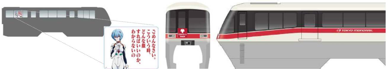
各車両内ステッカーイメージ