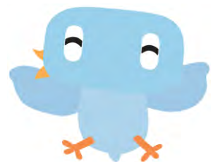
東京モノレールキャラクター モノルン

http://www.tokyo-monorail.co.jp/guidance/ryutsucenter/