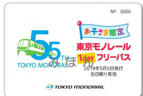
お子さま限定 東京モノレール1dayフリーパス（見本）