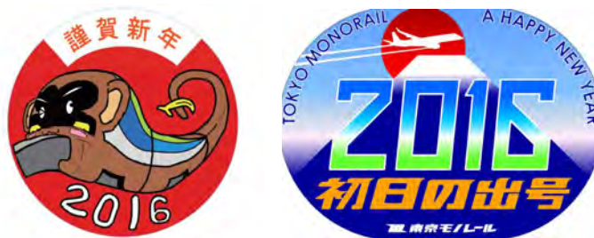
ヘッドマークイメージ