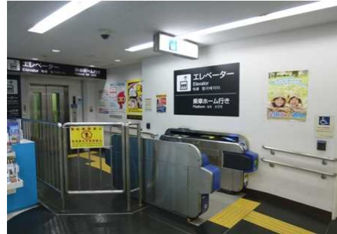
〔3階エレベーター（乗車ホームへ）〕