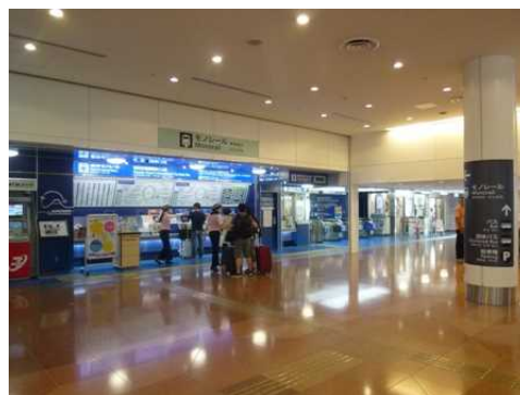
〔羽田空港国際線ビル駅3階改札口から出発ロビー〕〔羽田空港国際線ビル駅2階改札口〕