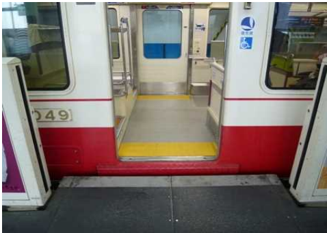
〔5階乗降車ホームスロープ〕