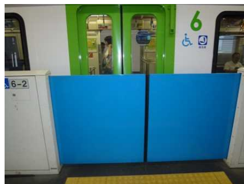
〔浜松町駅可動式安全柵〕