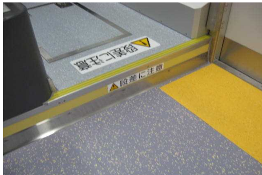
〔ドア開口部床識別色と車内床段差部の注意喚起表示 (黄色)〕