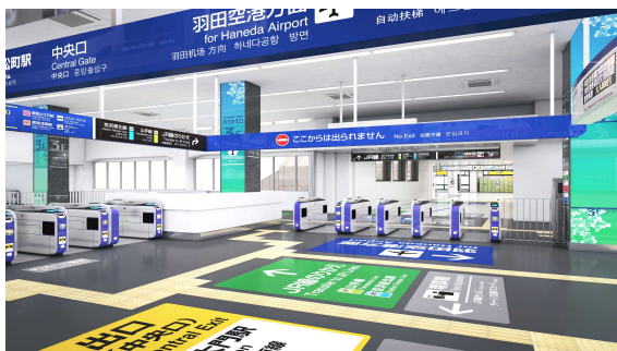
〔浜松町駅ワンラッチ改札〕

浜松町駅では、乗換連絡通路が JR 線からモノレールへの一方向のみのご利用でしたが、ワンラッチ化によりモノレールから JR 線への乗換えも同一通路（同一フロア）で可能となりました。また、3 階コンコースと 5 階ホームに繋がるエレベーターを設置しているほか、3 階コンコースから 1 階へのエレベーター、2 階南口改札前の荷物用コンベアーを設置しています。浜松町駅乗降車ホームの全車口に、車両とホームの隙間を縮小するためのスロープを設置して、大きな荷物をお持ちのお客さまや小さなお子さまでも、安全・スムーズな乗降車ができるようにしています。