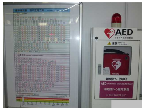
〔浜松町駅 AED (3 階コンコース・5 階乗車ホーム)〕