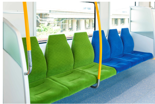
〔スタンションポール(橙色)〕