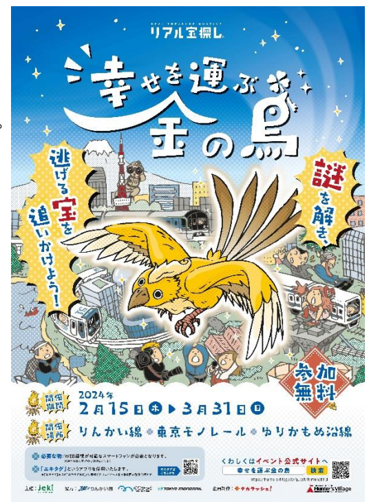
【ポスターイメージ】

本企画の内容については「タカラッシュ」が運営する「ハンターズヴィレッジ」( https://huntersvillage.jp/ )にて掲載いたします。(2月1日(木)14時オープン予定)