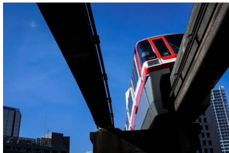
【1月】「合間を縫って」 撮影:鷺頭 空