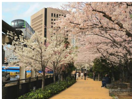
【4月】「桜咲く散歩道」