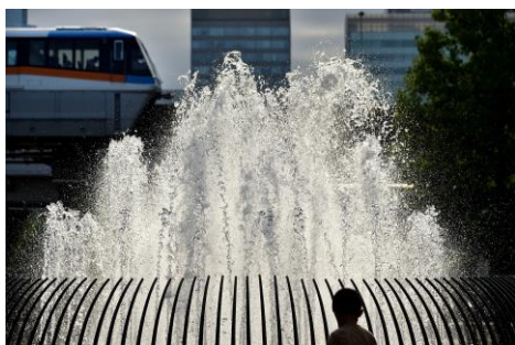
【7月】「涼 求めて」