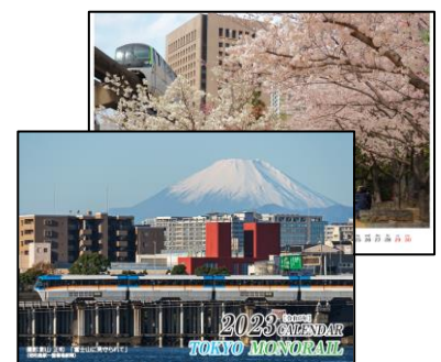
卓上カレンダー ※イメージ