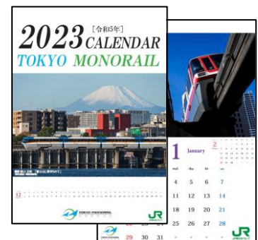
壁掛けカレンダー ※イメージ