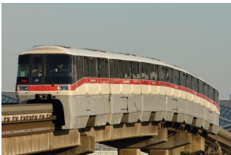
【3月】「夕陽を浴びて」