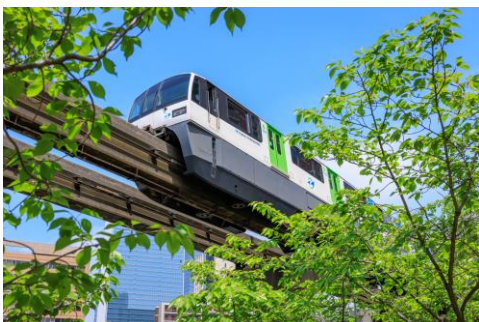
【5月】「新緑の向こうに」