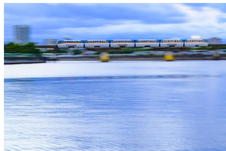
【6月】「羽田をつなげ!」