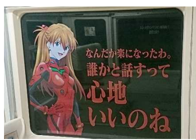
車内窓ガラスステッカー