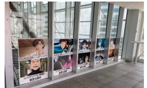
羽田空港第3ターミナル駅待合室には 社員デザインのポスターを展示