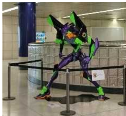
初号機フィギュア