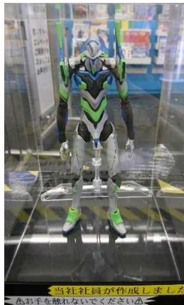
駅社員が装飾したオリジナル 初号機プラモデル